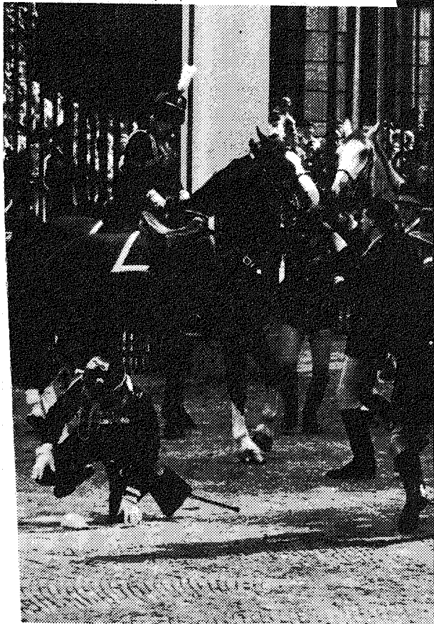
SPANJE 1936: ARRESTANTEN ONMIDDELIJK VRIJ!

STOP DE KRISISPOLITIEK SLUIT DE KERNCENTRALES STOP DE OORLOGSVOORBEREIDINGEN BAANLOZEN, 400 PIEK ERBIJ!!!!