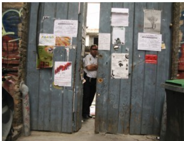
Desalojo del C.S.O. "La Fábrica de Sombreros"

El Grupo 17 de Marzo publicó un informe sobre el proceso de desalojo de La Fábrica de Sombreros, joven Centro Social en el centro de Sevilla.