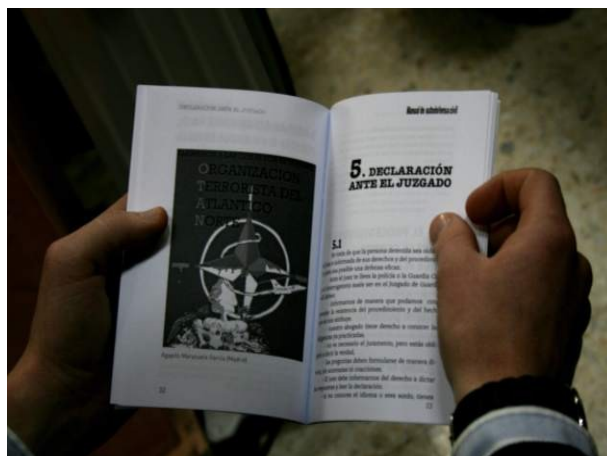
El Manual de Autodefensa Civil

La idea surgió como una necesidad que podía darse para la manifestación contra la cumbre que la OTAN realizaría en Sevilla durante los días 7 y 8 de Febrero. Desde el Grupo 17 de Marzo estimábamos que existía en la sociedad un amplio desconocimiento de los derechos más elementales, incluyendo el derecho de manifestación, por lo que se perseguía con esta pequeña guía dar un poco de luz sobre estas cuestiones. El texto completo del manual figurará en nuestra página web.