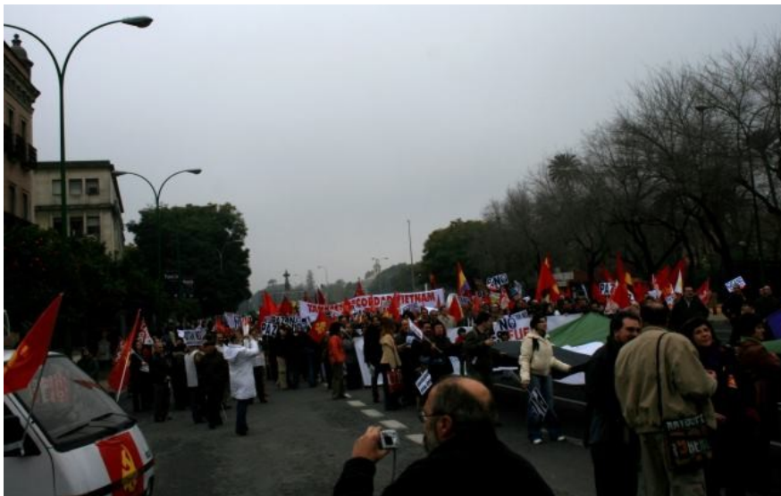
Foto de la movilización contra la Cumbre de mandatarios de la OTAN