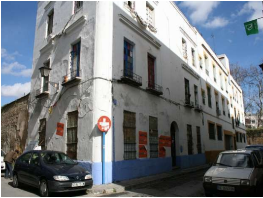
Viviendas anexas al C.S.O.A. Casas Viejas