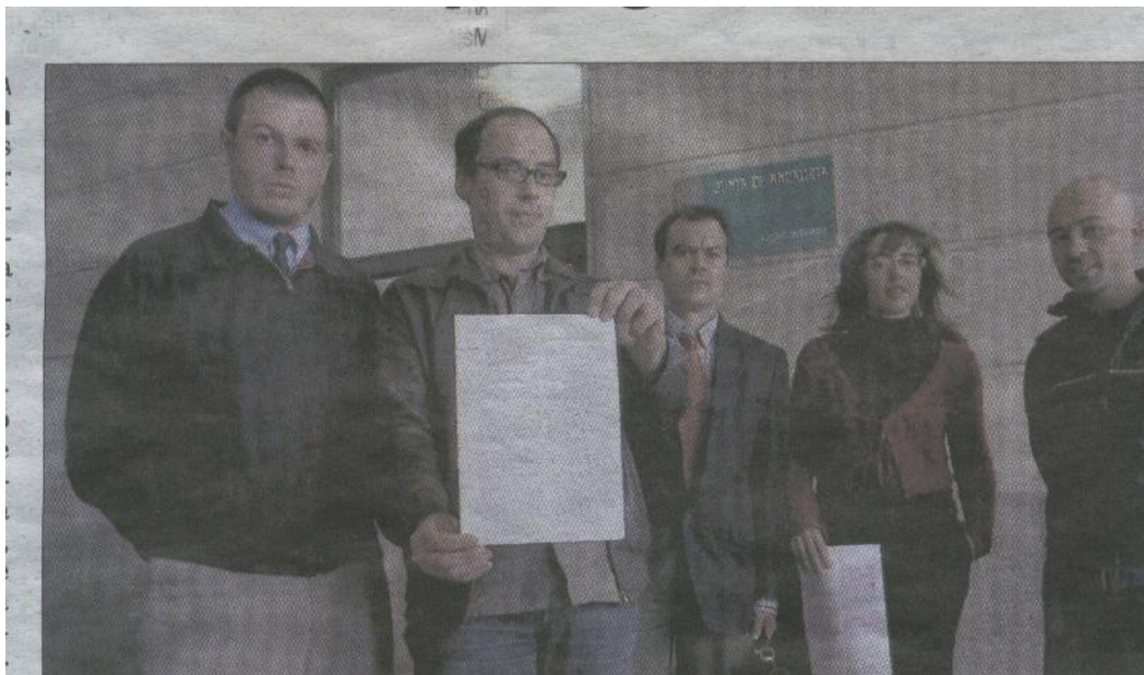
Menos horas de detenciones. La Comisión Provincial de la Policía Judicial ha ampliado dos veces al día el traslado de los detenidos desde las dependencias policiales de Blas Infante hasta el Juzgado de Guardia de que el Tribunal Constitucional diera el amparo a un recurso presentado por los juristas del Grupo 17 de

La victoria en este recurso, sumada a los numerosos contactos con miembros del Colegio de Abogados y del poder judicial en Sevilla, supuso que se estableciera una segunda conducción, de tarde, que se sumaba a la de mañana. Se estimó que esta nueva puesta a disposición ahorraría a los detenidos unas 108.000 horas anuales.